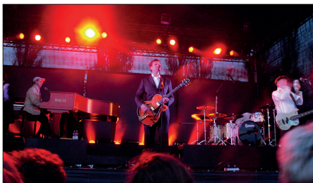
Kom med til koncert med Big Fat Snake.